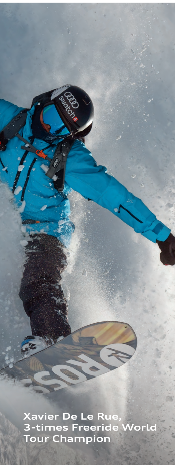
Xavier De Le Rue, 3-times Freeride World Tour Champion